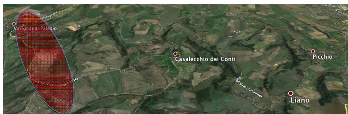
Fig. 2.2 - vista a volo d'uccello da sud (sistema forestale e crinali)